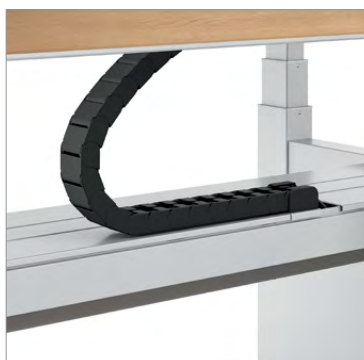
Chaîne porte-câbles reliant la table au chemin de câbles