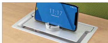
Porte d'accès avec support d'appareil, prise USB, alimentation et guide-fils en option