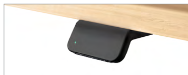
Contrôle de série permettant d'emmagasiner 2 positions; fonctionnalité Bluetooth