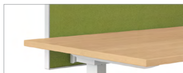
Cloisonnette montée à la surface de travail