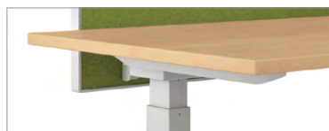
Pied télescopique (réglage à 2 étages illustré)