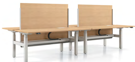
Cloisonnette fixe en mélamine