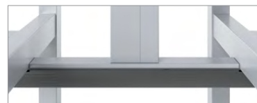
Alimentation du plafond