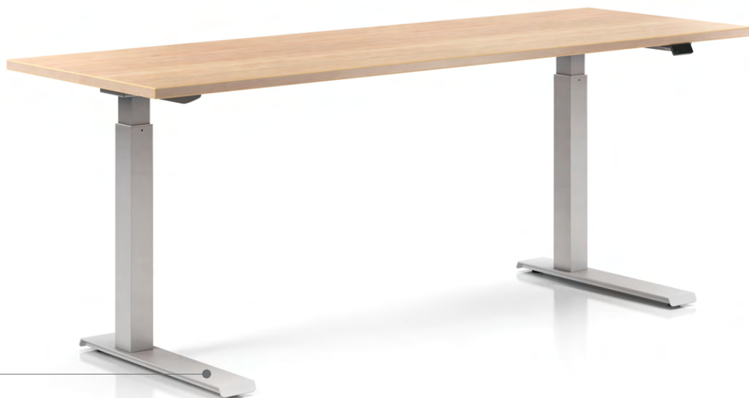
Pied en C