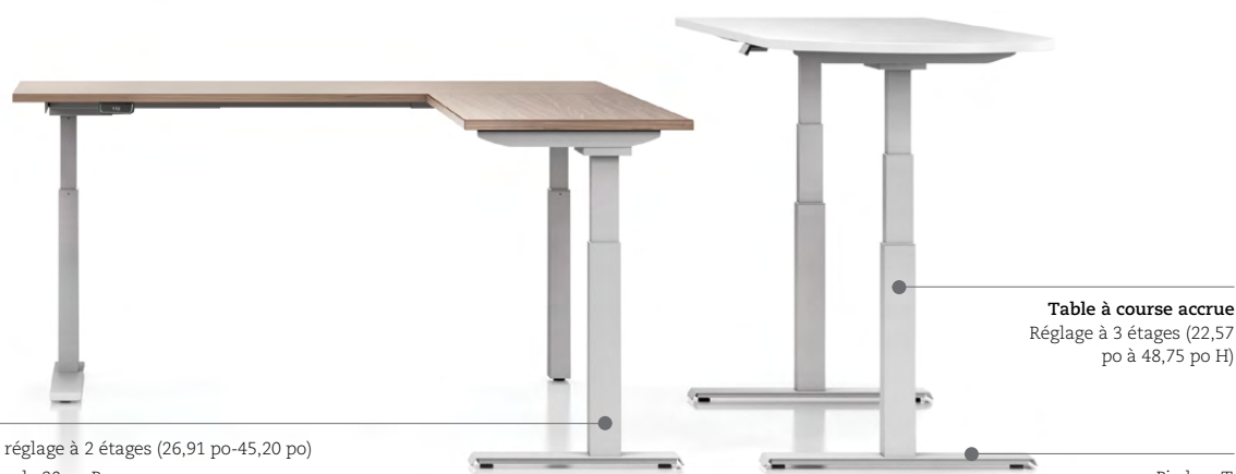
Table à course accrue Réglage à 3 étages (22,57 po à 48,75 po H)