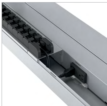
Chemin de câbles