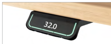
Contrôle à affichage numérique en option permettant d'emmagasiner 4 positions; fonctionnalité Bluetooth