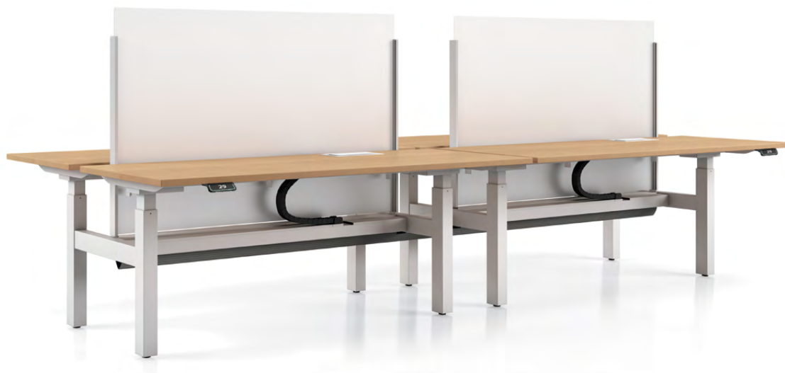
Cloisonnette fixe vitrée