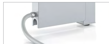
Alimentation du plancher