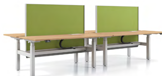
Cloisonnette fixe encadrée

Il est possible de favoriser les choix individuels et la personnalisation des espaces tout en encourageant la collaboration. Intégrez la capacité de réglage en hauteur là où vous en avez besoin le long d'un banc de travail tout en conservant une apparence unifiée.