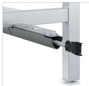
Raccord table à table