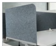
Cloisonnette enveloppante en feutre PET